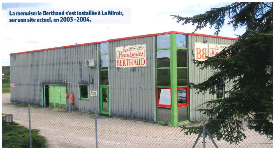
La menuiserie Berthaud s'est installée à Le Miroir, sur son site actuel, en 2003-2004.