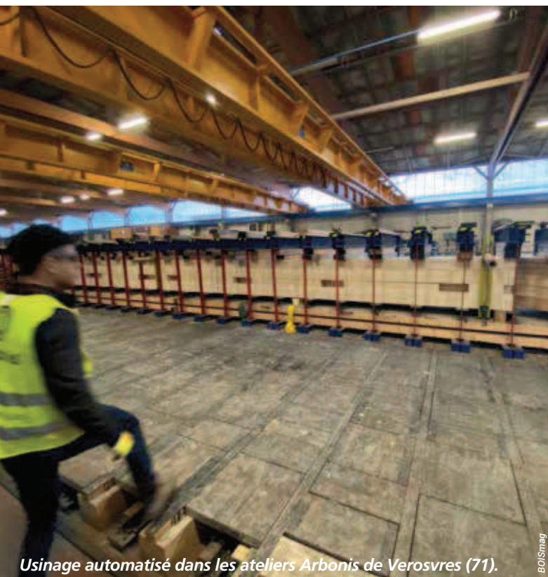
Usinage automatisé dans les ateliers Arbonis de Verosvres (71).