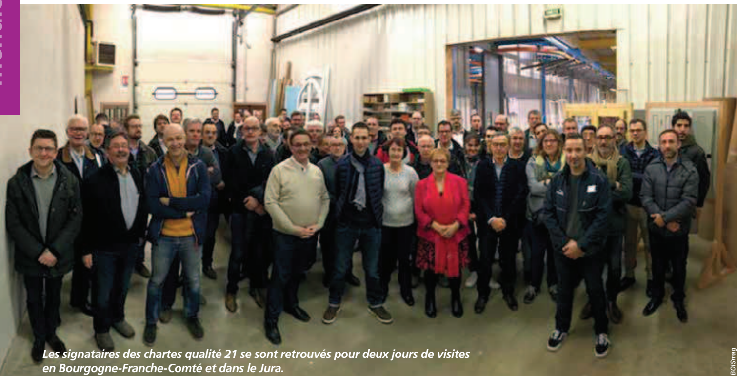
Les signataires des chartes qualité 21 se sont retrouvés pour deux jours de visites en Bourgogne-Franche-Comté et dans le Jura.