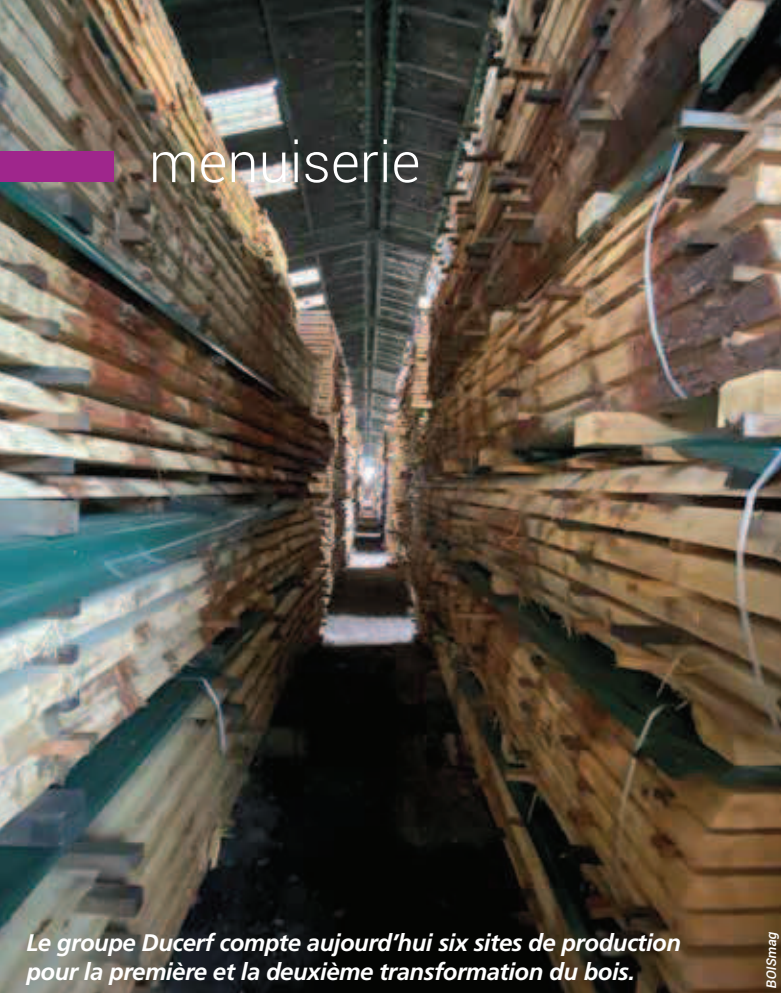
Le groupe Ducerf compte aujourd'hui six sites de production pour la première et la deuxième transformation du bois.